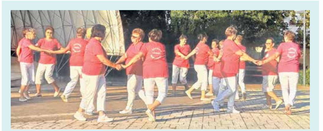
„A tánc, feltölt, átformál és jókedvre derít!”

Az ember a családon kívül a szomszédokkal van a legtöbbet együtt. S bizony, mint ahogy a közmondás is tartja: „Rossz szomszédság török átok!” – lehet, ha valaki nem